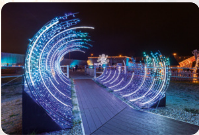
Tunnel zur Unterwasserwelt

Folgende Pressebilder stehen Ihnen zum Download zur Verfügung (die Vorschaubilder sind mit dem hochauflösenden Material verlinkt). Das gesamte Pressematerial zum Download finden Sie HIER . (Auflösung: 300 dpi)