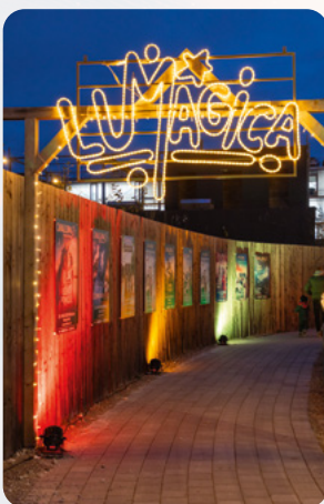
Eingang zum Lichterpark