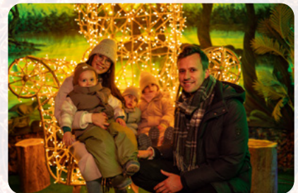
Spaß für Groß und Klein