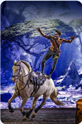
Die Rettung des Herzens