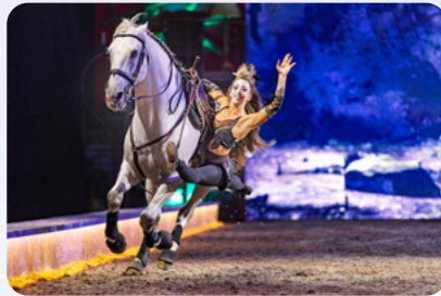
Ein Sprung im Herzen