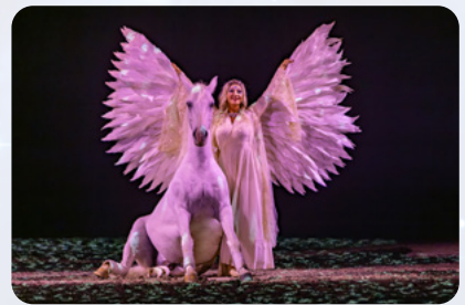
Trols erste große Liebe