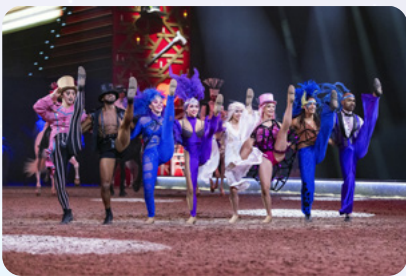
Chorus Line der Dance Company

Folgende Pressebilder stehen Ihnen zum Download zur Verfügung (die Vorschau-bilder sind mit dem hochauflösenden Material verlinkt). Das gesamte Presse-material zum Download finden Sie HIER . (Copyright: CAVALLUNA // Auflösung: 300 dpi)