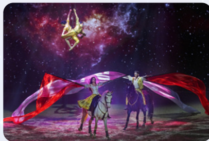
Ein Gefühl von Erfüllung