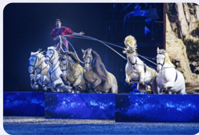
Ungarische Post von Diego Giona