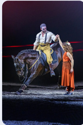
Révérance von Alejandro Barrionuevo