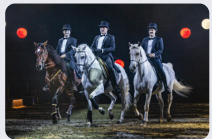
Pas de trois der Freunde