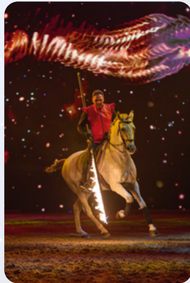
Equipe Pfeifer mit Feuergarrocha