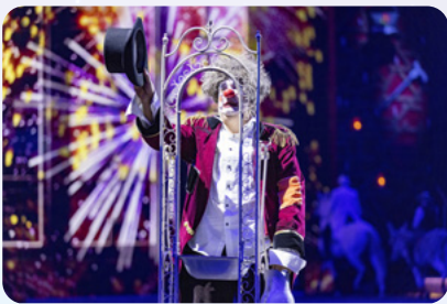
Trols letzte Show

Folgende Pressebilder stehen Ihnen zum Download zur Verfügung (die Vorschaubilder sind mit dem hochauflösenden Material verlinkt). Das gesamte Pressematerial zum Download finden Sie HIER . (Copyright: CAVALLUNA // Auflösung: 300 dpi)