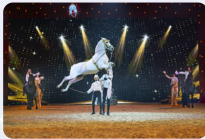
Kapriole der Equipe Valença