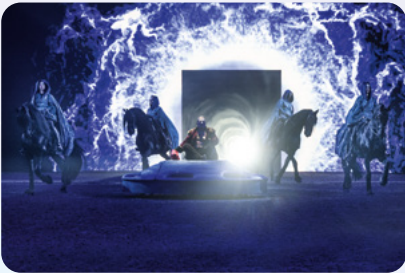
Die innere Mitte

Folgende Pressebilder stehen Ihnen zum Download zur Verfügung (die Vorschaubilder sind mit dem hochauflösenden Material verlinkt). Das gesamte Pressematerial zum Download finden Sie HIER . (Auflösung: 300 dpi)