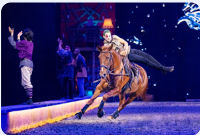
Durch Mut beflügelt