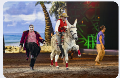
Spaß mit dem Langohr