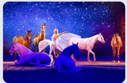
Ein Gefühl von Freiheit