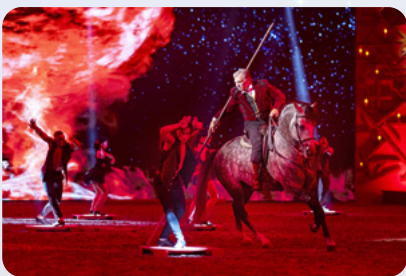
Eine schlechte Erinnerung