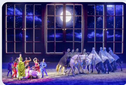
Ein wunderbarer Traum