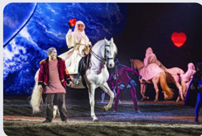
Trols Herz ist erfüllt