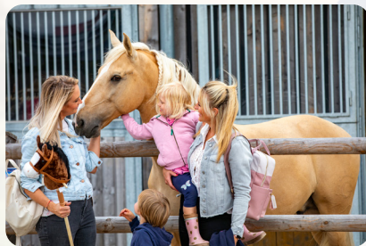
Pferd im CAVALLUNA Park