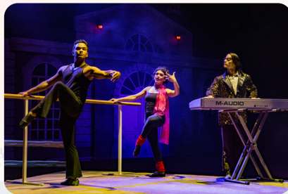
Tanzen will gelernt sein