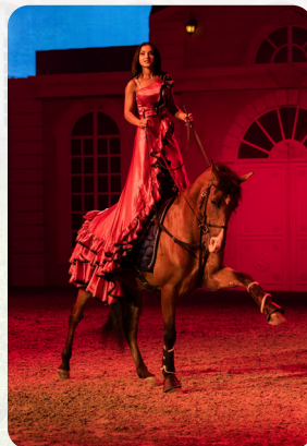
Schwere Lektion aus dem Stand