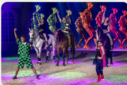
Pisa Duro für alle