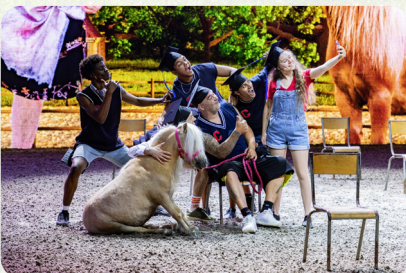
Ein Selfie zwischendurch...