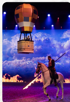
Feuer für eine Ballonfahrt