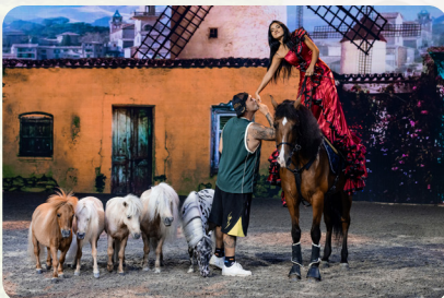
Mit Ponys Herzen erobern