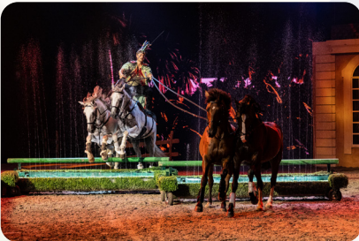
Der Meister der ungarischen Post