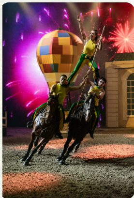
Eine Pyramide der besonderen Art