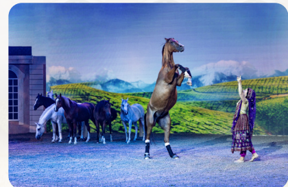
Schöne Momente der Freiheit