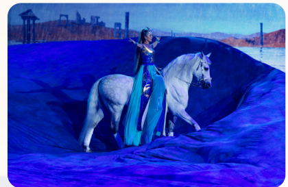
Die Amazone des Wassers