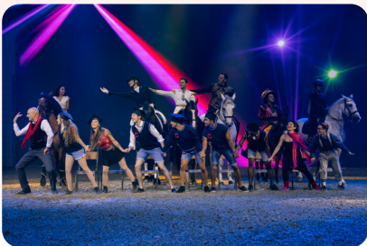
Die CAVALLUNA Horse Academy

Folgende Pressebilder stehen Ihnen zum Download zur Verfügung (die Vorschaubilder sind mit dem hochauflösenden Material verlinkt). Das gesamte Pressematerial zum Download finden Sie HIER . (Auflösung: 300 dpi)